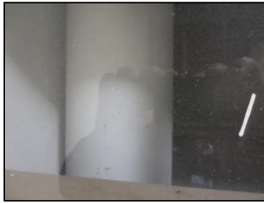
Photo N° 694 AMIANTE CIMENT 3 SAINT EXUPERY-RDC à +4- LOCAL V.O Vide-ordures Gaine V.O.(Fibres-ciment)