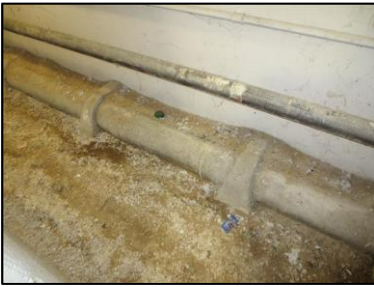
Photo N° 693 AMIANTE CIMENT 5 SAINT EXUPERY-S.sol-COULOIRS DE CAVES Planchers Chute E.U.(Fibres-ciment)