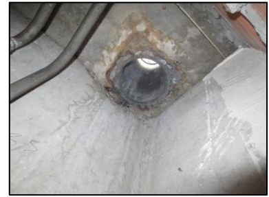
Photo N° 696 AMIANTE CIMENT 3 SAINT EXUPERY AU +4- PLACARDS GAZ Plafonds Ventilation haute (Fibres-ciment)