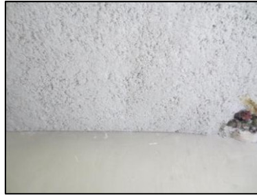
Photo N° 718 ECH-N°12 FLOCAGE 11 ST EXUP SOUS STATION-S.sol- LOCAL 1 Plafonds FLOCAGES