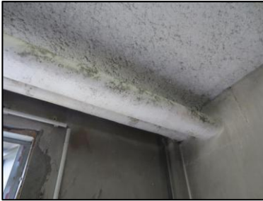
Photo N° 717 ECH-N°11 CALORIFUGEAGE 11 ST EXUP SOUS STATION-S.sol-LOCAL 1 Conduits de fluide Liège + plâtre