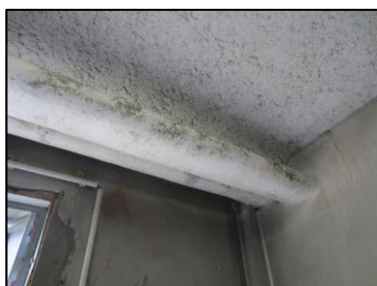
Photo N° 717 ECH-N°11 CALORIFUGEAGE 11 ST EXUP SOUS STATION-S.sol-LOCAL 1 Conduits de fluide Liège + plâtre