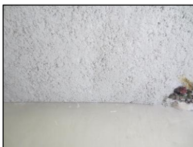
Photo N° 718 ECH-N°12 FLOCAGE 11 ST EXUP SOUS STATION- S.sol-LOCAL 1 Plafonds FLOCAGES