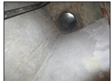
Photo N° 704 AMIANTE CIMENT 19 LORIENT- +4-PLACARDS GAZ Plafonds Ventilation haute (Fibres-ciment)