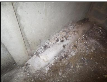
Photo N° 702 AMIANTE CIMENT 19 LORIENT-S-SOL-COULOIRS DE CAVES Conduits de fluide Chute E.U.(Fibres-ciment)