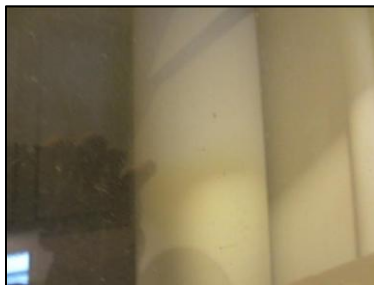
Photo N° 703 AMIANTE CIMENT 19 LORIENT-RDC à +4-LOCAL V.O Vide-ordures Gaine V.O.(Fibres-ciment)