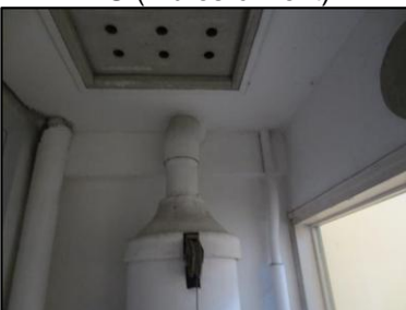
Photo N° 705 AMIANTE CIMENT 19 LORIENT+4-LOCAL V.O Plafonds Ventilation haute (Fibres-ciment)