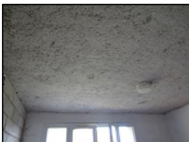
Photo N° 162 ECH-N°1 FLOCAGE -- Local vélo Plafonds cotonneux blanc

Dossier n°: 2013-09-300 FK DTA PC 003LA3 OPH