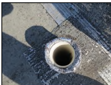
Photo N° 36 AMIANTE CIMENT -- Toiture Terrasse Conduits Ventilation haute (Fibres-ciment)