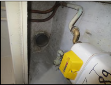
Photo N° 541 AMIANTE CIMENT -- Gaine technique 4 Gainés & coffres horizontaux Ventilation haute (Fibres- ciment)