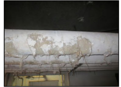
Photo N° 529 ECH-N°2 CALORIFUGEAGE Sous sol Conduits de fluide Laine minérale + enveloppe plâtrée