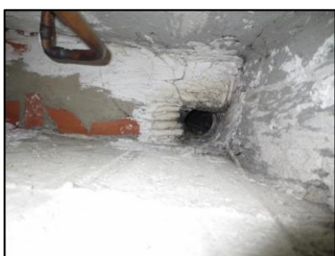
Photo N° 1160 AMIANTE CIMENT - -nc-PLACARDS TECHNIQUE GAZ +4 Conduits Ventilation haute (Fibres-ciment)