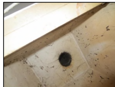
Photo N° 436 AMIANTE CIMENT Gaine technique Gaz 3 Conduits Ventilation haute (Fibres-ciment)