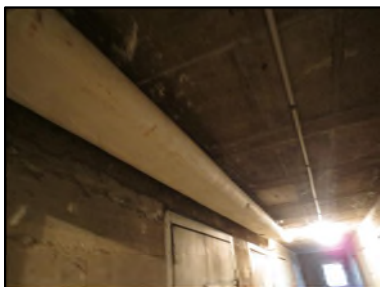
Photo N° 427 ECH-N°1 CALORIFUGEAGE COULOIR DE CAVE Conduits de fluide Laine minérale + enveloppe plâtrée

Dossier n°: 2013-09-300 FK DTA PC 009LAF