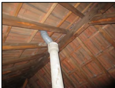
Photo N° 433 AMIANTE CIMENT Combles Conduits Ventilation haute (Fibres-ciment)